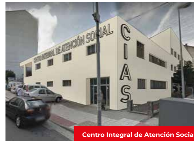
Centro Integral de Atención Social