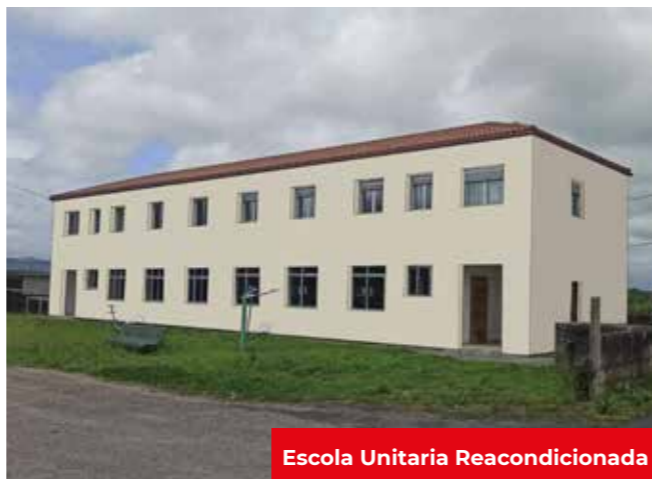
Escola Unitaria Reacondicionada